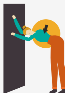
COLUMNA Y PECTORALES